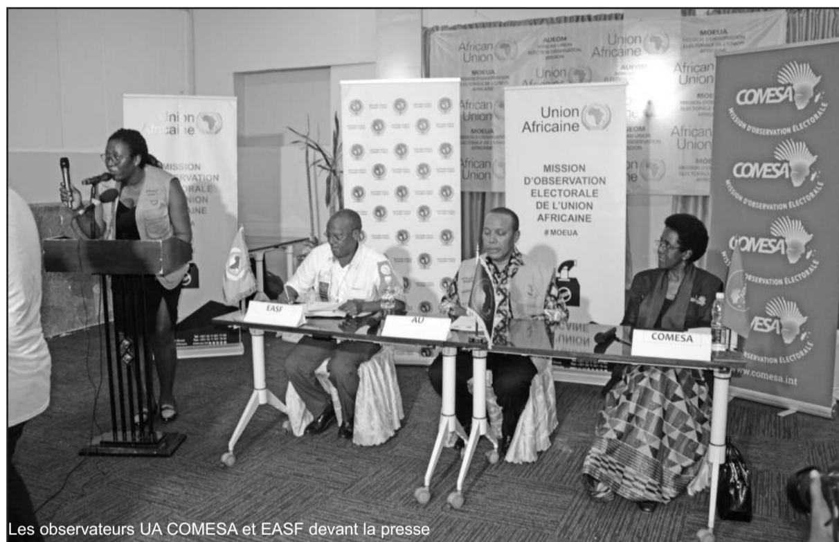
Les observateurs UA COMESA et EASF devant la presse

Ces derniers recommandent au gouvernement de voir la manière de