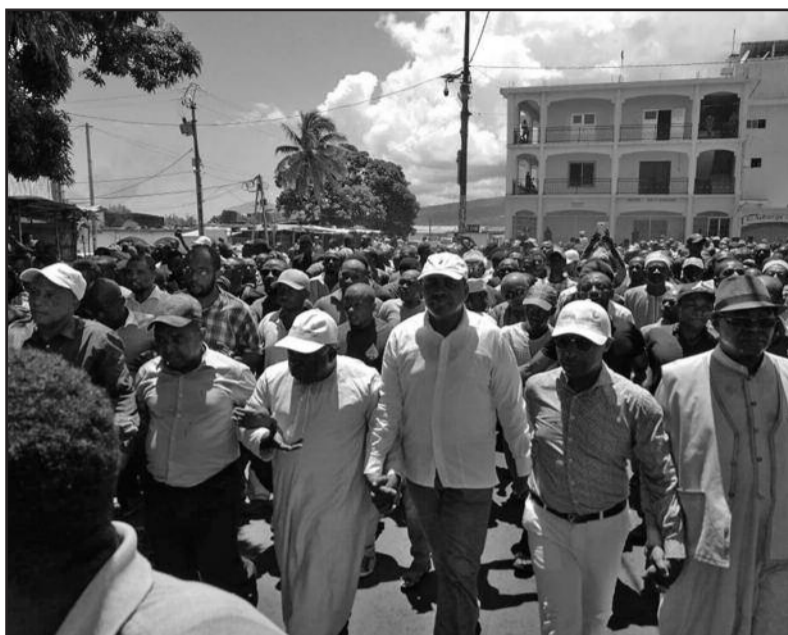
.Les candidats de l'opposition battent le pavé avec leurs militants