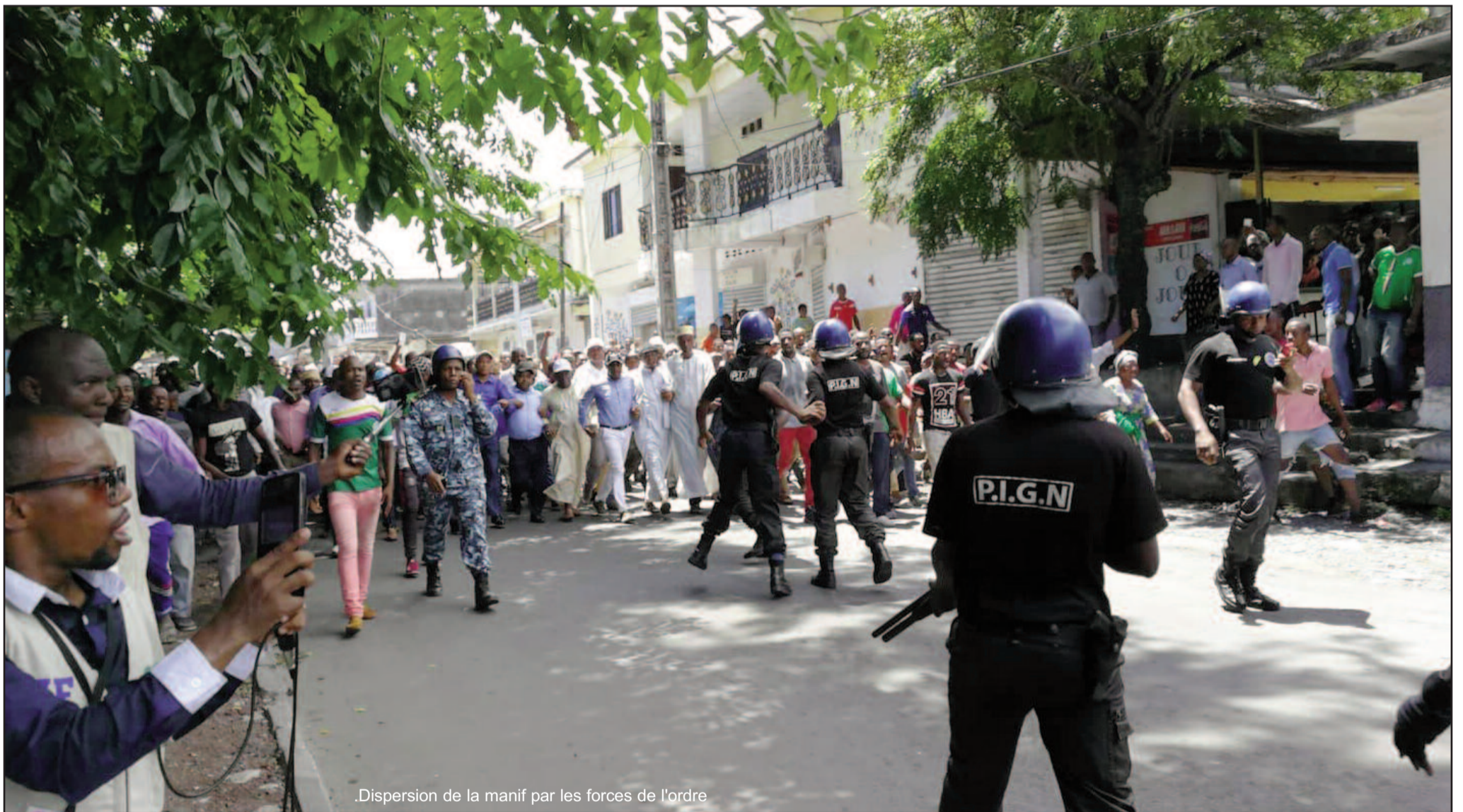
.Dispersion de la manif par les forces de l'ordre